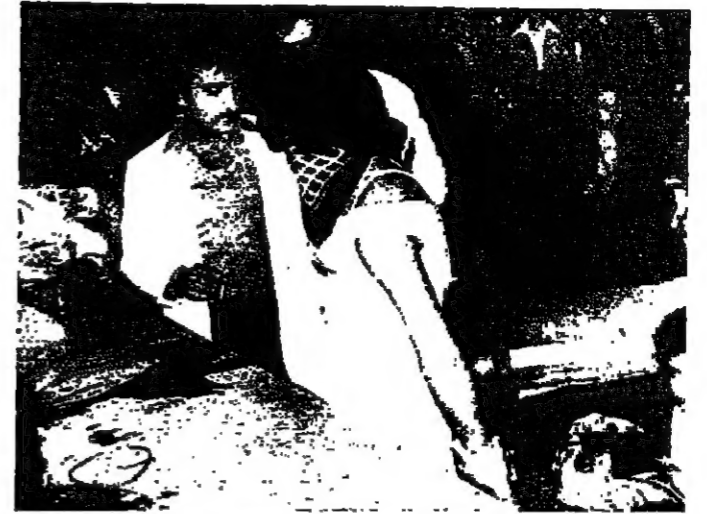
عصب العينين، وطلاء الجين واللياب بالدهانات الملوثة من ضمن البرنامج

وساء بعض طلاب المعهد ان يلقوا بصور «الأخبار» من غير قراءة للنشر، وعضوا على محاضرته في محاولة لانتزاع الفيلم منه، إلا ان